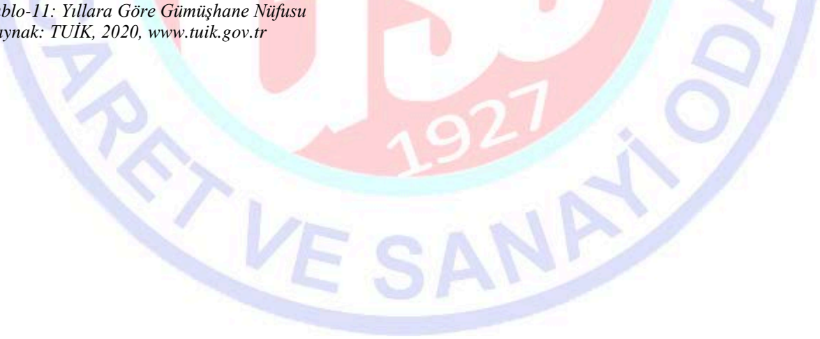
Tablo-11: Yıllara Göre Gümüşhane Nüfusu