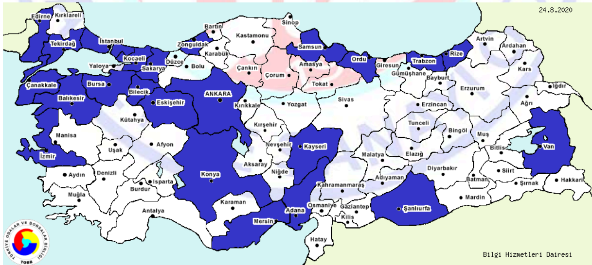
Şekil-1: İllere Göre Banyo Küvetleri, Duş Tekneleri, Lavabolar, Plastikten İmalatı Yapan Firmaların Dağılımı Kaynak: TOBB Sanayi veri tabanı 2020,

Proje ile üretilecek ürünler genel olarak 22.23.07-Plastikten banyo küvetleri, lavabolar, klozet kapakları, oturakları ve rezervuarları ile benzeri sıhhi ürünlerin imalatı (kalıcı tesisat için kullanılan montaj ve bağlantı parçaları dahil) sektörü olarak kabul edilmektedir. Buna bağlı olarak Gümüşhane ile ilgili veriler aşağıda verilmiştir. Görüleceği gibi ilde bu alanda faaliyet gösteren bir işletme bulunmamaktadır.