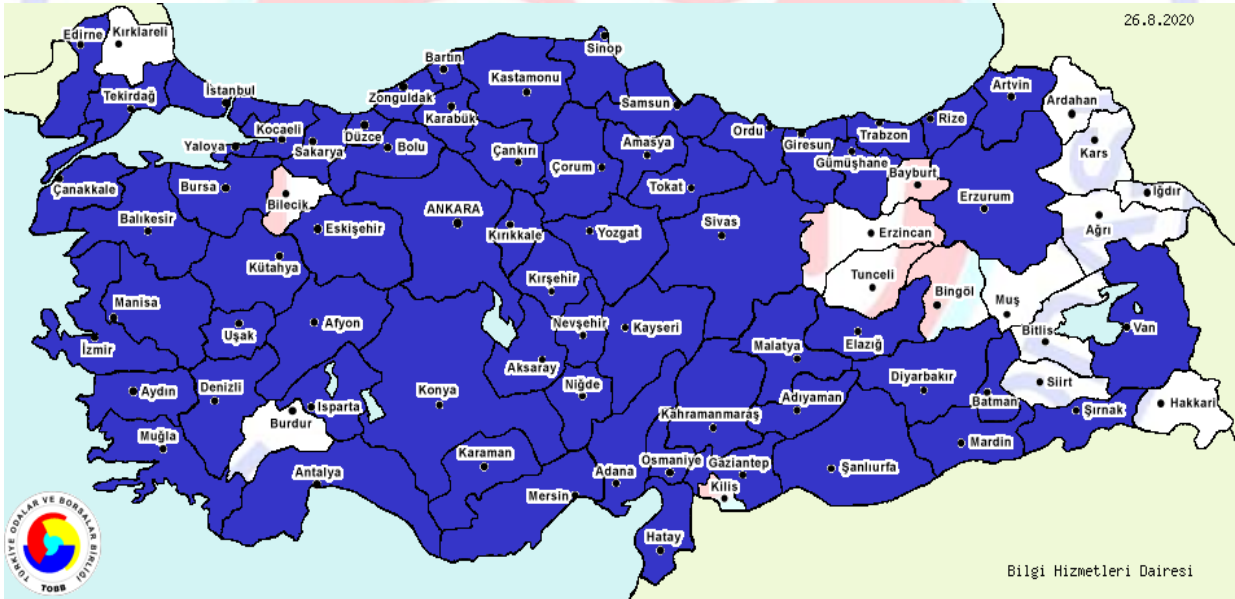
Şekil-1: İllere Göre Mutfak Mobilyaları İmalatı Yapan Firmaların Dağılımı, 2020.

Proje ile mutfak mobilyaları imalatı yapılacaktır. Buna göre TOBB sanayi veri tabanına göre Türkiye genelinde mutfak mobilyaları imalat yapan firmalar hakkında bilgi aşağıda verilmektedir.