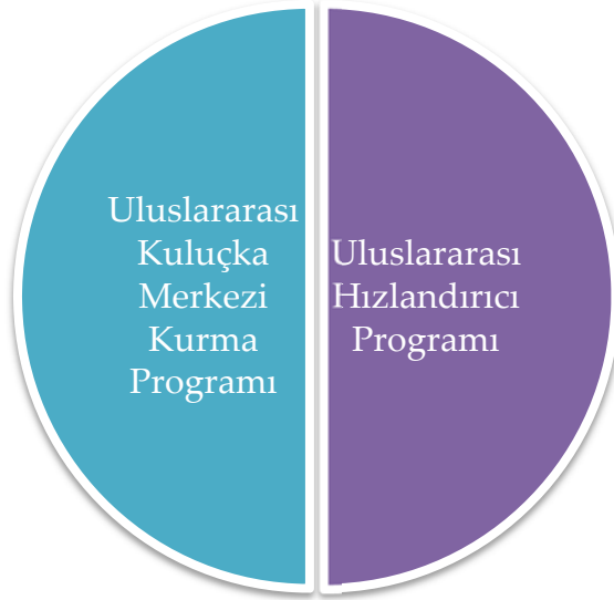
Şekil 2. KOSGEB'in Uluslararası Kuluka Merkezi ve Hızlandırıcı Destek Programı