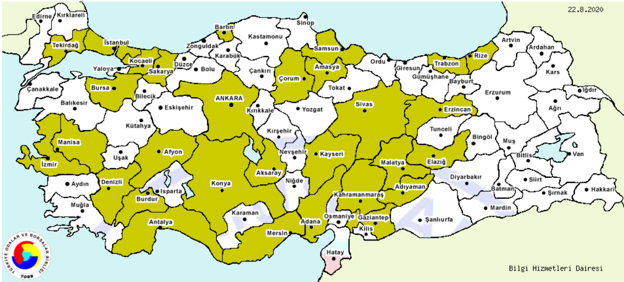
Şekil-1: Sofra, Mutfak veya Diğer Ev Eşyaları ile Bunların Parçalarının İmalatını Yapan İllerin Dağılımı

Sofra, mutfak veya diğer ev eşyaları ile bunların parçaları (demir, çelik, bakır ve alüminyumdan)