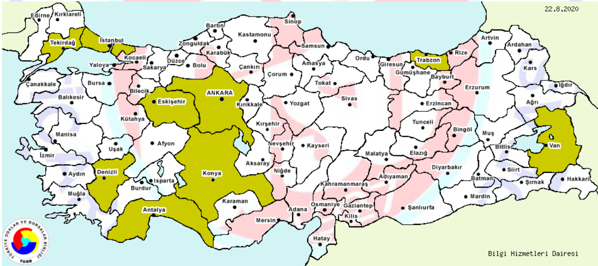
Şekil-2: İllere Göre Kaşık, Çatal, Bıçak Gibi Ürünlerin İmalatını Yapan Firmalar

Kaşık, çatal, kepçe, kevgir, servis spatulası, balık bıçağı, kahvaltı ve meyve bıçağı, şeker maşası ve benzeri mutfak gereçleri ve sofrta takımları imalatı yapan firmalar.