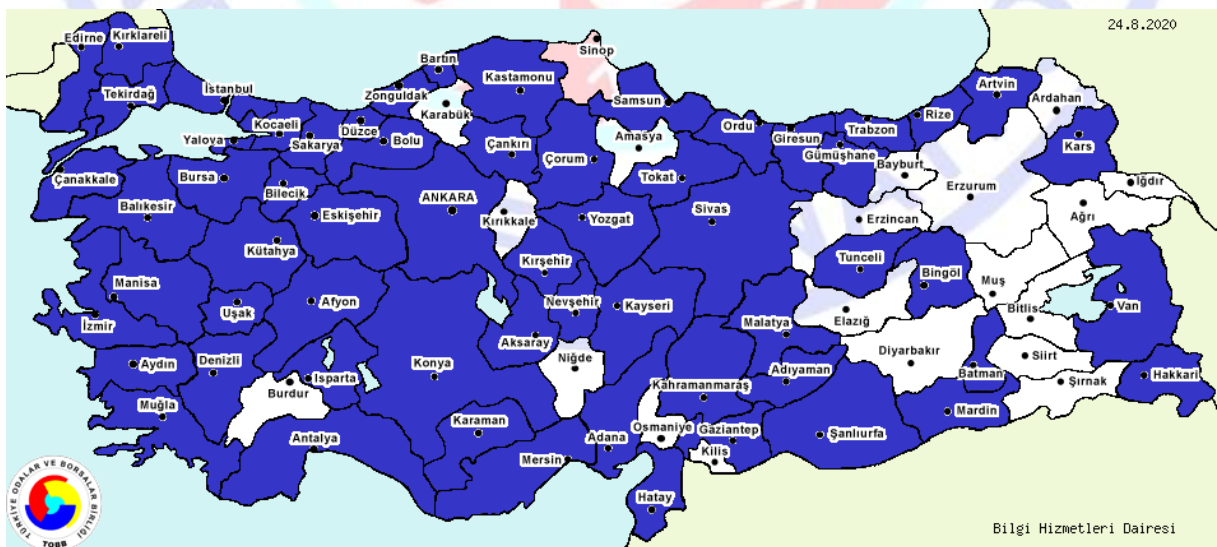
Şekil-1: İllere Göre Plastikten Pencereler ve Bunların Çerçevesi ile Pervazları ve Pencere Eşikleri İmalatını Yapan Firmaların Dağılımı.

Plastikten pencereler ve bunların çerçeveleri ile pervazları ve pencere eşikleri