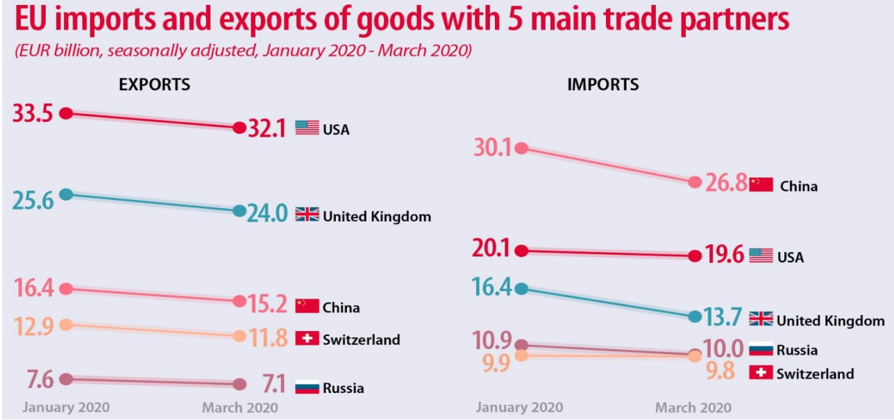
Şekil 1: Ocak-Mart 2020 Aylarında AB’nin İhracat ve İthalat Değişimi

Avrupa İstatistik Kurumu (Eurostat) tarafından 15 Mayıs 2020 tarihinde yayınlanan dış ticaret verileri incelendiğinde Mart ayında AB dışı ülkelere yapılan ihracat ve ithalat toplamının Ocak ayına kıyasla 252 milyar Euro seviyesinden 228 milyar Euro seviyesine gerilediği görülmektedir. Söz konusu gerileme durumu 5 ana ticaret ortağına yapılan ihracatların hepsi için geçerli olsa da en yüksek düşüşlerden biri %-7,1 oranı ile Çin’de yaşanmıştır. 5 ana ortaktan yapılan ithalatlar ele alındığında ise en önemli düşüşün %-11 ile Çin’den yapılan ithalatı etkilediği görülmektedir.